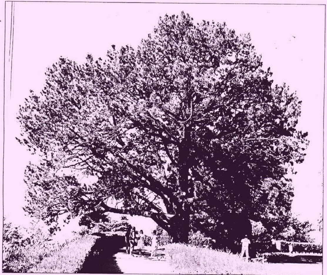
Imaxe dinha das árbores senlleiras que foman parte do patrimonio galego.

Ademais, Rigueiro explica que se fixo unha investigación de novas árbores e formacións senlleiras; recibimos información de moitas persoas e percorremos moitos montes galegos e xardíns públicos e privados da comunidade.